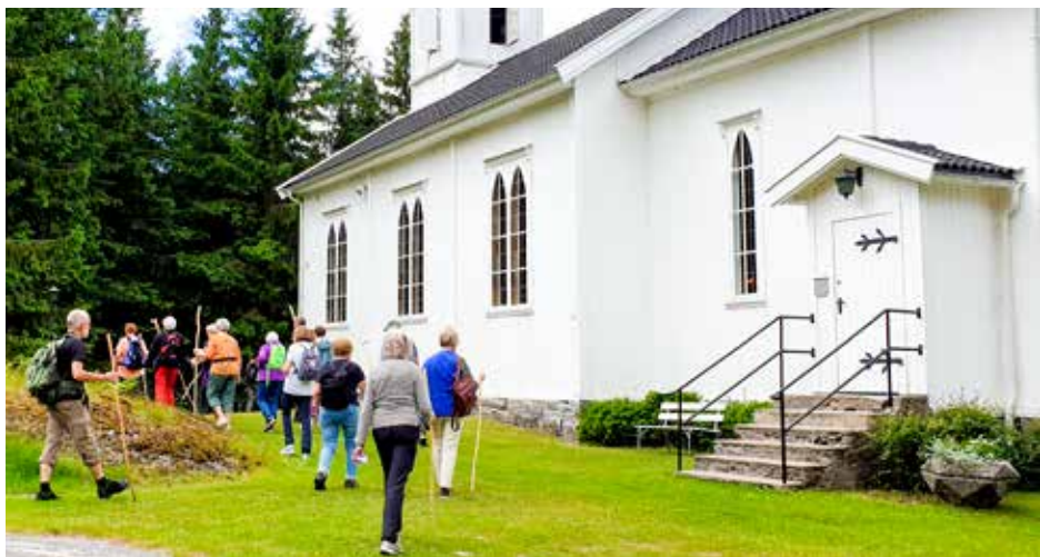
Ved vandringens mål