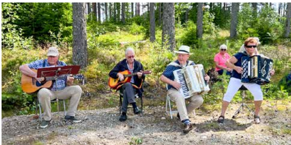
Tekst og foto: Per Vidar

På vegne av pilegrimskomiteen, Per Vidar Iversen.