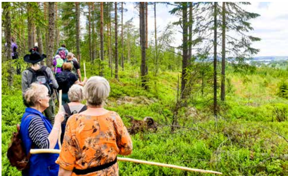
Utsikt mot Rødenessjøen. Vi aner målet: Klund kirke