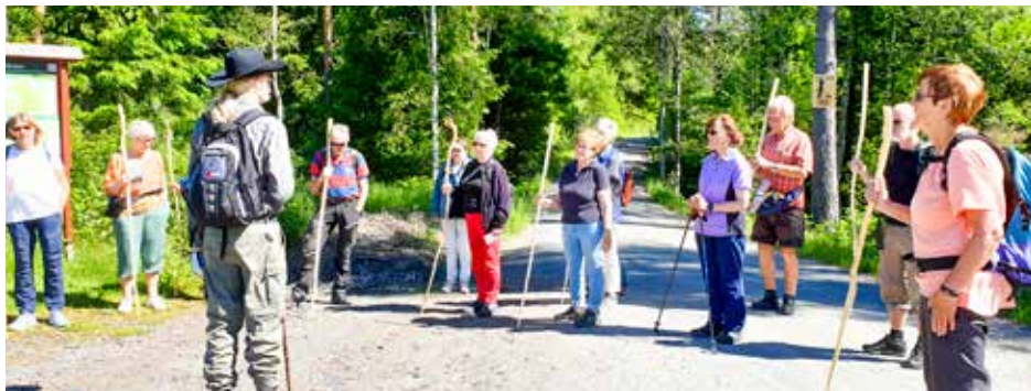
Fra vandringens start ved Sukken camping

Gå stille og rolig, i takt med hjerteslagene. Oppdag naturen, deg selv og Gud. -Dette er et av pilegrimens syv nøkler, som vi fikk utdelt i programmet ved starten av vandringen.