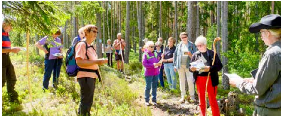
Mange stopp for bønner, sang og påminnelser om det vakre i naturen