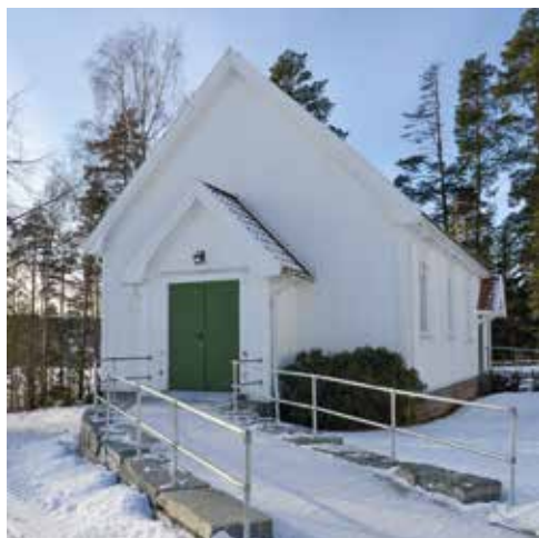
Kirkevergen