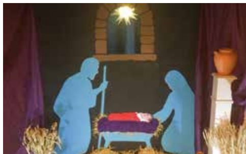
Siste post: Stallen