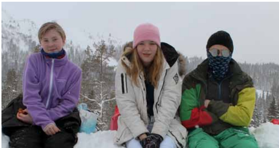
Godt med et pust i bakken