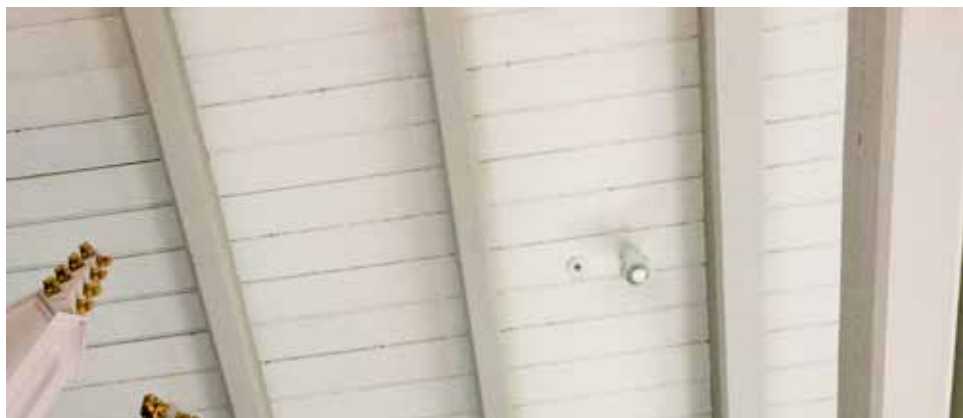
Brannvarslerne og slukkedysene er plasert i taket ute i gangen og inne i kirken

Det er installert nytt brannsluknings- og brannvarslingsanlegg i Aremark kirke. Anlegget blir i hovedsak skjult og lite synlig. Det er godt å vite at vi nå er sikret på beste måte, dersom det skulle oppstå en brann i kirken vår.