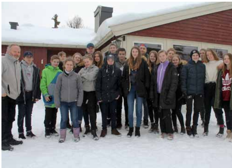
Klar for hjemreise etter en flott helg på fjellet