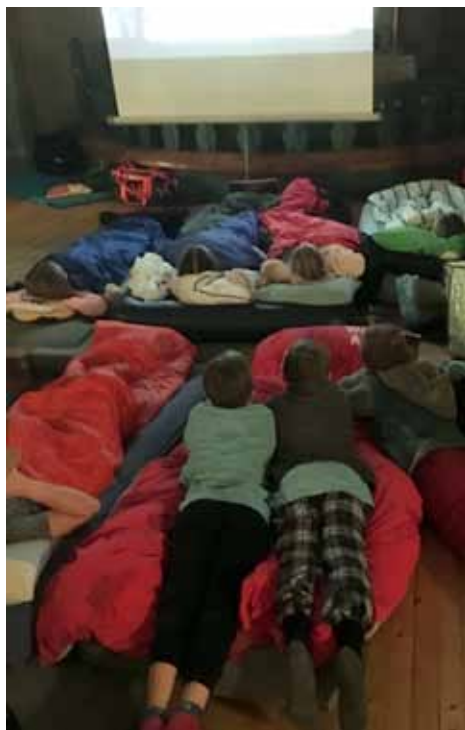
Før de la seg, så de bl.a. film.

tekst: Anita Lislegaard /Ann Kristin Huse