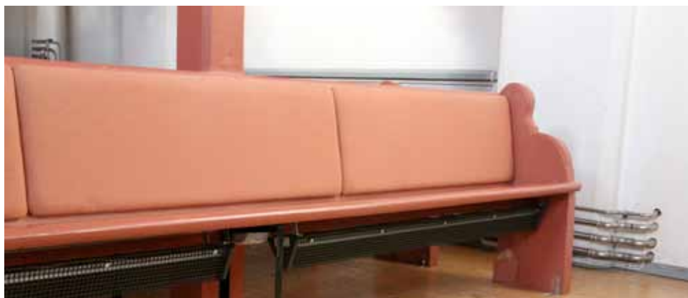
Dette er de nye varmeovnene.