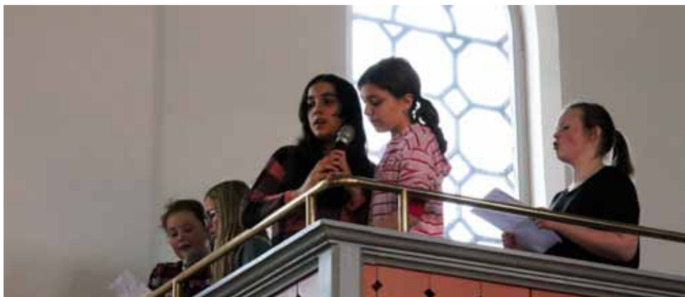
På søndag deltok disse med sang