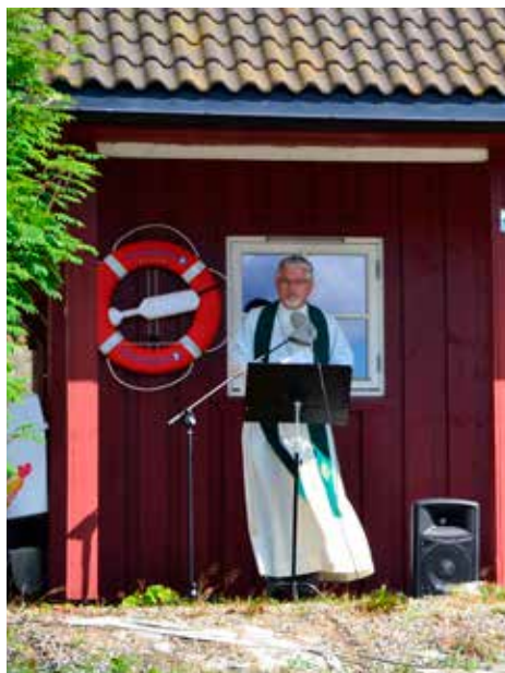
Tekst: E.S.Søby

Etter gudstjenesten hadde familien Rørvik, vertskapet på camping, igjen ordnet med kaffe og deilig gjærbakst av mange slag i kiosken. Hjertelig takk!