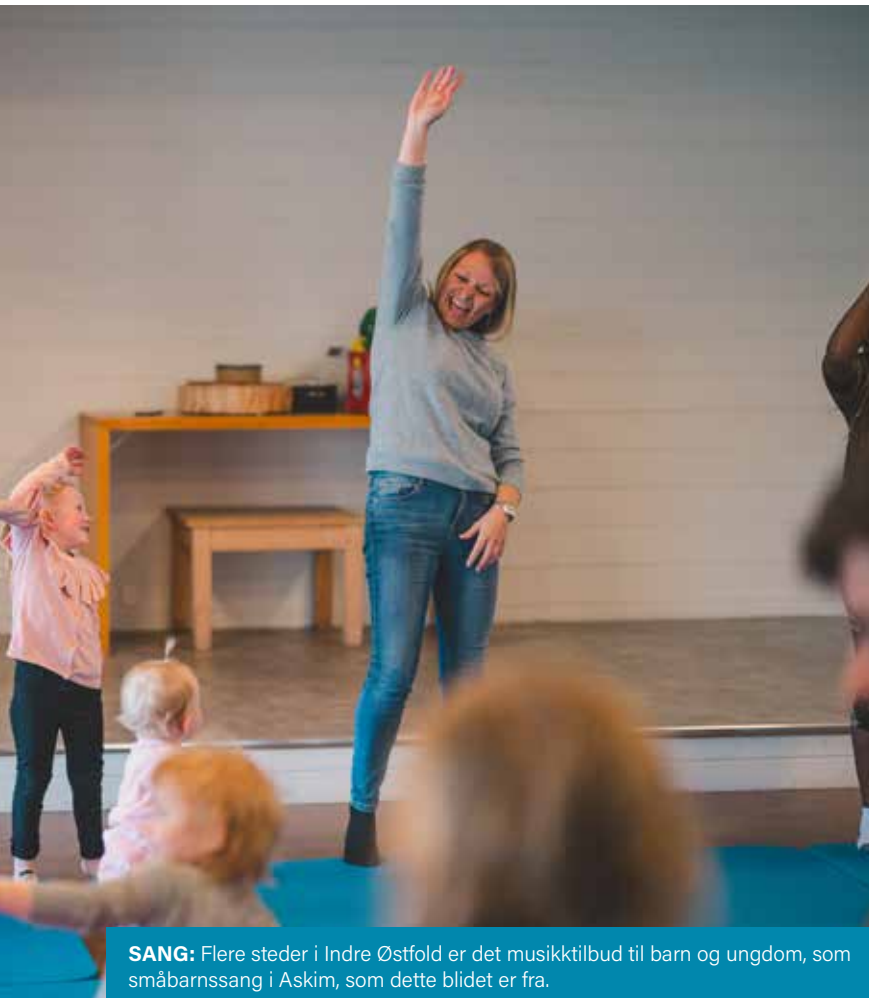
SANG: Flere steder i Indre Østfold er det musikktilbud til barn og ungdom, som småbarnssang i Askim, som dette bildet er fra.

Tomter menighetssenter: 15. sept, 20. okt, 17. nov, 8. des. KRIK/After-KRIK (8. klasse og oppover) Fredager kl. 19.00 Facebook: KRIK/After-KRIK Hobøl