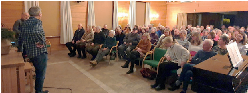
Stappfullt på Vikersund menighetssenter.