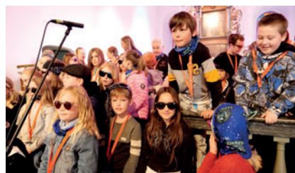
Verdens kuleste tårnagenter.