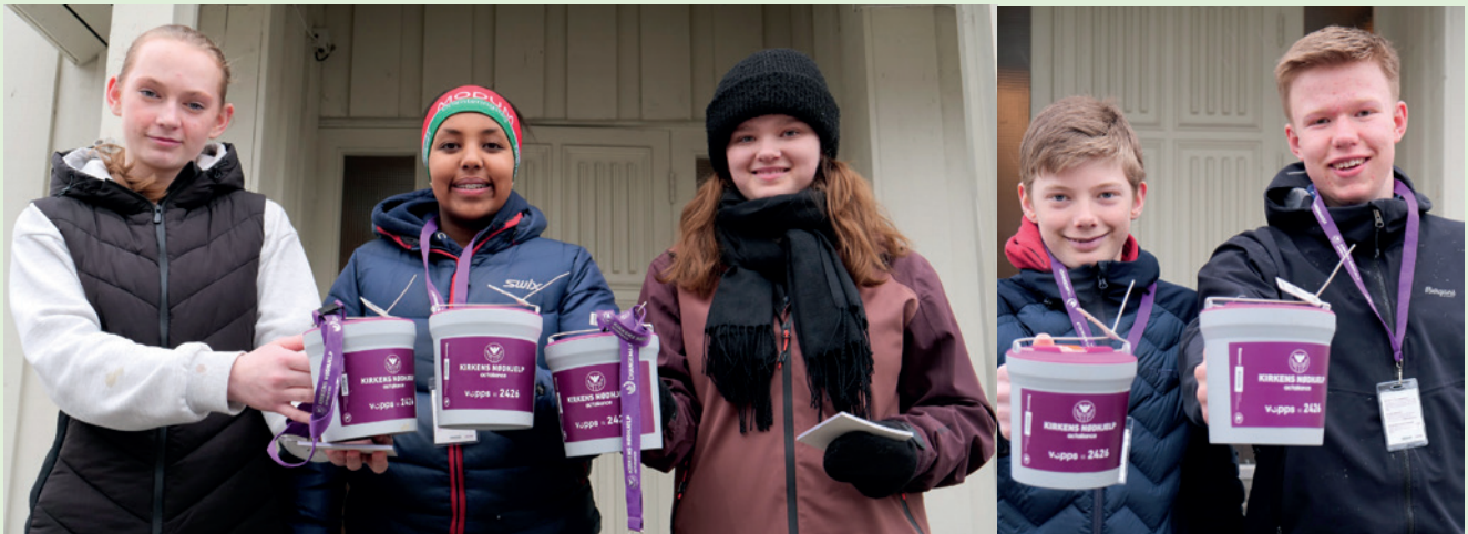
Flinke konfirmanter med innsamlingsbøsser for Fasteaksjonen. Det var litt surt og kaldt så konfirmantene måtte kle seg godt.