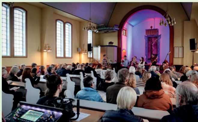
Fullsatt Vestre Spone kirke og ny rekord for Sang og salmekveld.