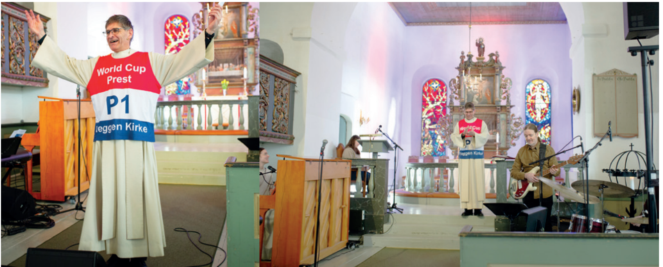
Sokneprest Geir ønsker alle hjertelig velkommen og bandet spiller opp til sportsgudstjeneste!