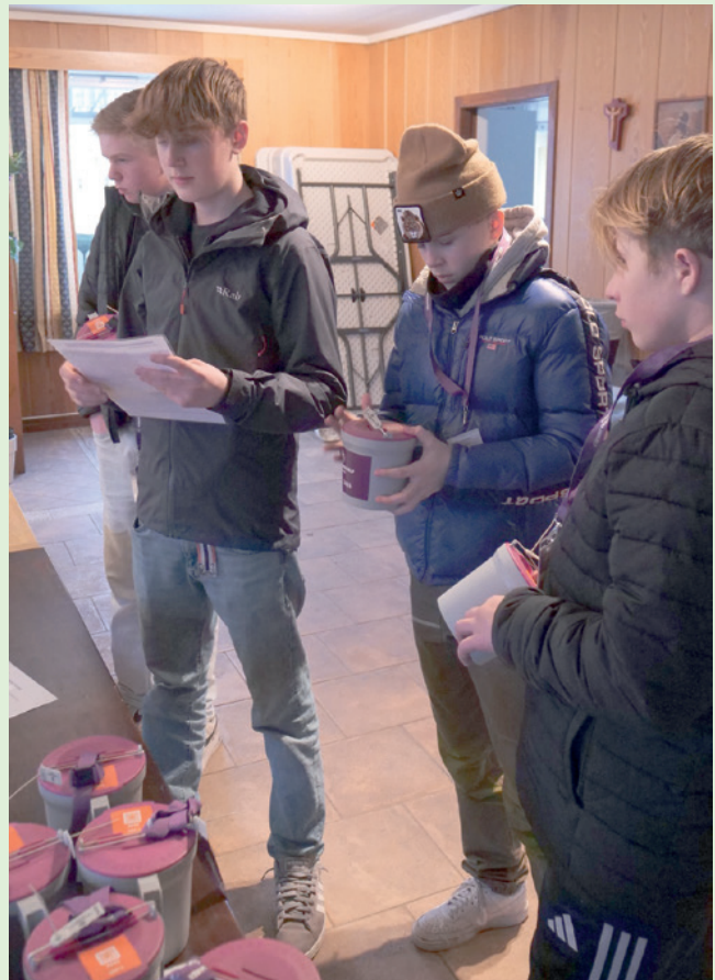
Konfirmentene får utdelt bøsser og roder.

Støtten vi gir, er med på å bidra til at Kirkens Nødhjelp kan fortsette å drive det livsviktige arbeidet med å sikre at stadig flere får varig tilgang til rent vann, samt mye annet arbeid innen nødhjelp og langsiktig bistand. Kirkens nødhjelp jobber for fred og rettferdighet, og for å redde liv.