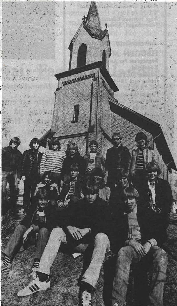
En del av Snarums konfirmanter samlet til undervisning. Disse blir konfirmert 31. mai.

Ja, hold fast hva du har! Du fikk da som barn, de til dåpen deg bar.