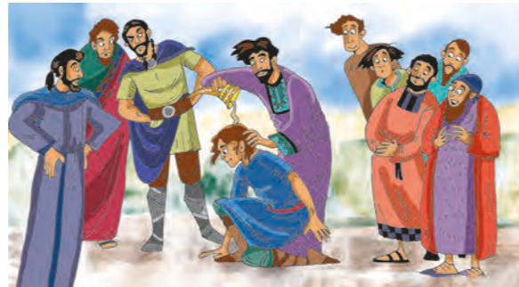
Tegning: Kari Sortland

Samuel hørte mange ting fra Gud. Da Samuel ble voksen fortalte Gud ham hvem som skulle bli konge. Kan du finne fem feil på bildet under?