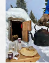
Palmesøndag ved Pølen

Søndag, 3. mai 5. søndag i Påsketiden Øyer kirke, kl. 11.00 Gudstjeneste med dåp Tretten kirke, kl. 18.00 «Senk-skuldrene»-gudstjeneste