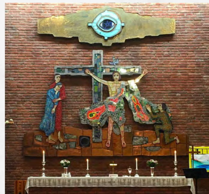
Alterbildet er laget av Victor Sparre til Hunn kirke i Gjøvik.

Påskeevangeliet er fantastisk. Det er utgangspunktet for verdens største håpsbevegelse. Det er en fortelling som gir mennesker troen på livet og kjærligheten – tross alt.