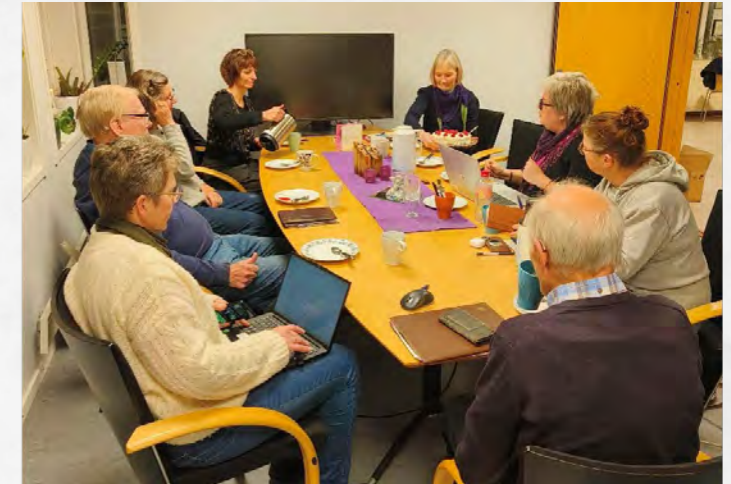
Jubileumskomiteen har virkelig fortjent ei bløtkake!

Øyer kommune bevilget 100 000 til feiringen, samt bidrag til folkegaven som skal gå til lyssetting på kirkevangelen. Kirken ble nymalt utenpå og vasket innvendig, oppkjørsel og kirkevangel ble opprustet, kantsteiner satt opp og gjerder restaurert og malt.