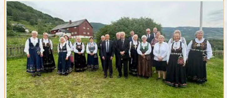
Seniorkoret var jubileumskor for Øyer kirke 300 år