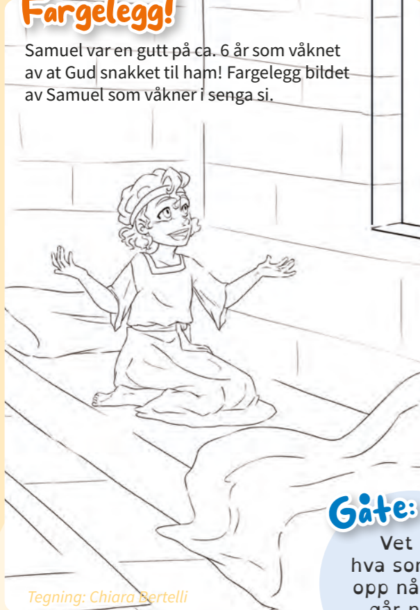
Tegning: Chiara Bertelli

Samuel var en gutt på ca. 6 år som våknet av at Gud snakket til ham! Fargelegg bildet av Samuel som våkner i senga si.