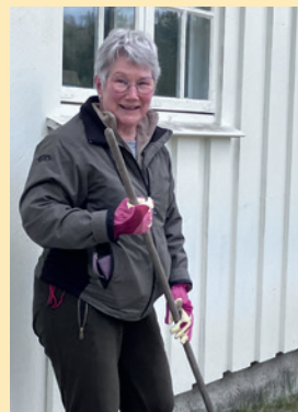
Dugnad Hof Finnskog.