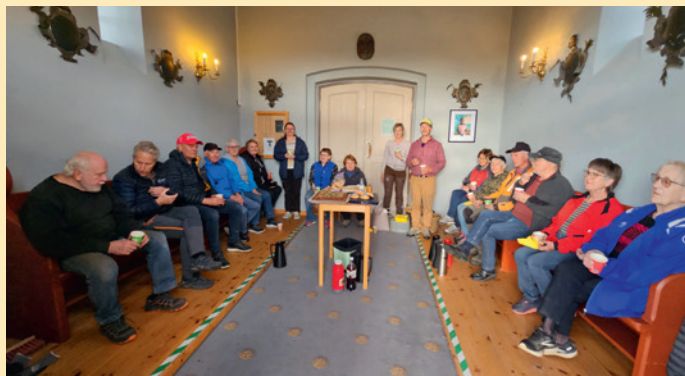
Dugnad i Hof kirke. Foto: Anne B. Edvardsen.

Dugnad Åsnes Finnskog kirke 11. mai. Vi var heldig med været selv om det var sur vind. Flike dugnadsfolk møtte opp med god arbeidsånd. Kirkegården og minnelunden ble raket og klipt, så det ble veldig pent og klargjort for fine vår og sommer dager. Wenche serverte kaffe og kaker i kirkestua. Takk for en vel gjennomført dugnad! Tekst og foto; Line M. Lie.