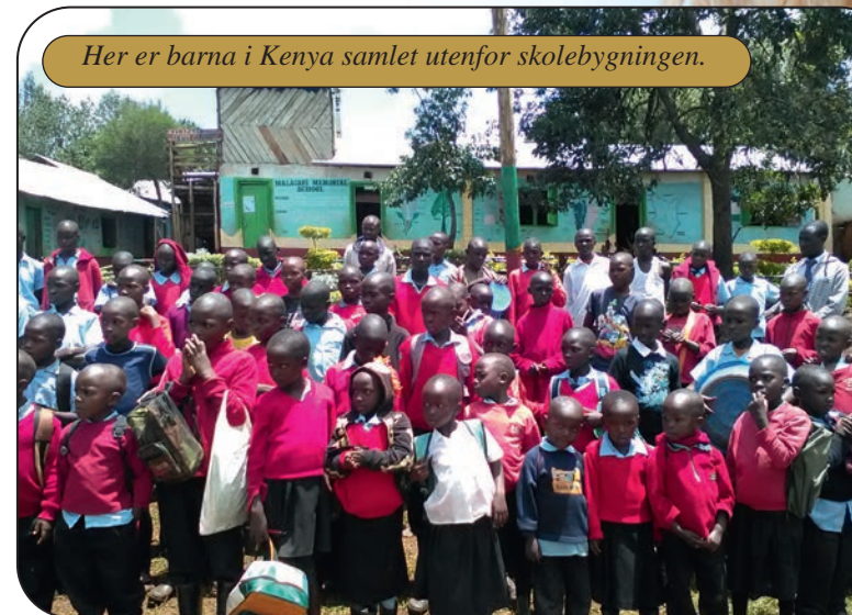
Her er barna i Kenya samlet utenfor skolebygningen.