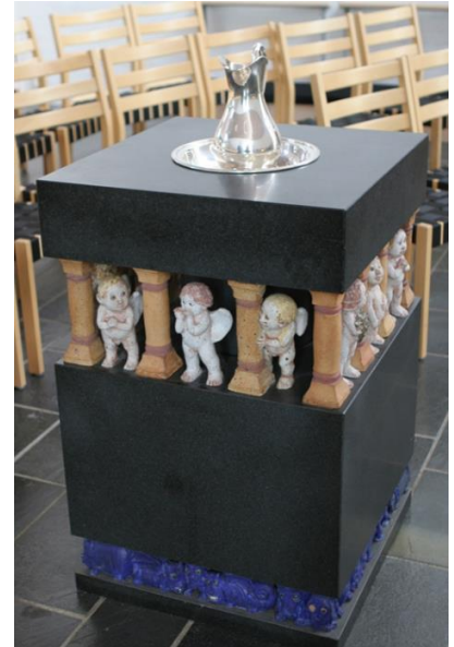
Døpefont, Såner kirke