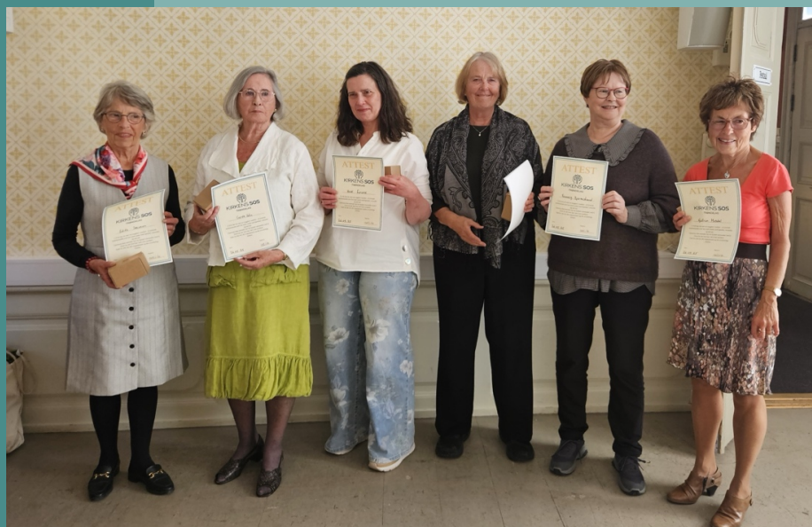
Sommeravslutning hos Kirkens SOS Trøndelag.