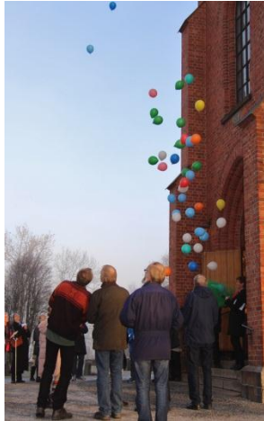
Salmeslipp med ballongslipp!