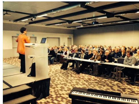
Fra Borg Lederforum