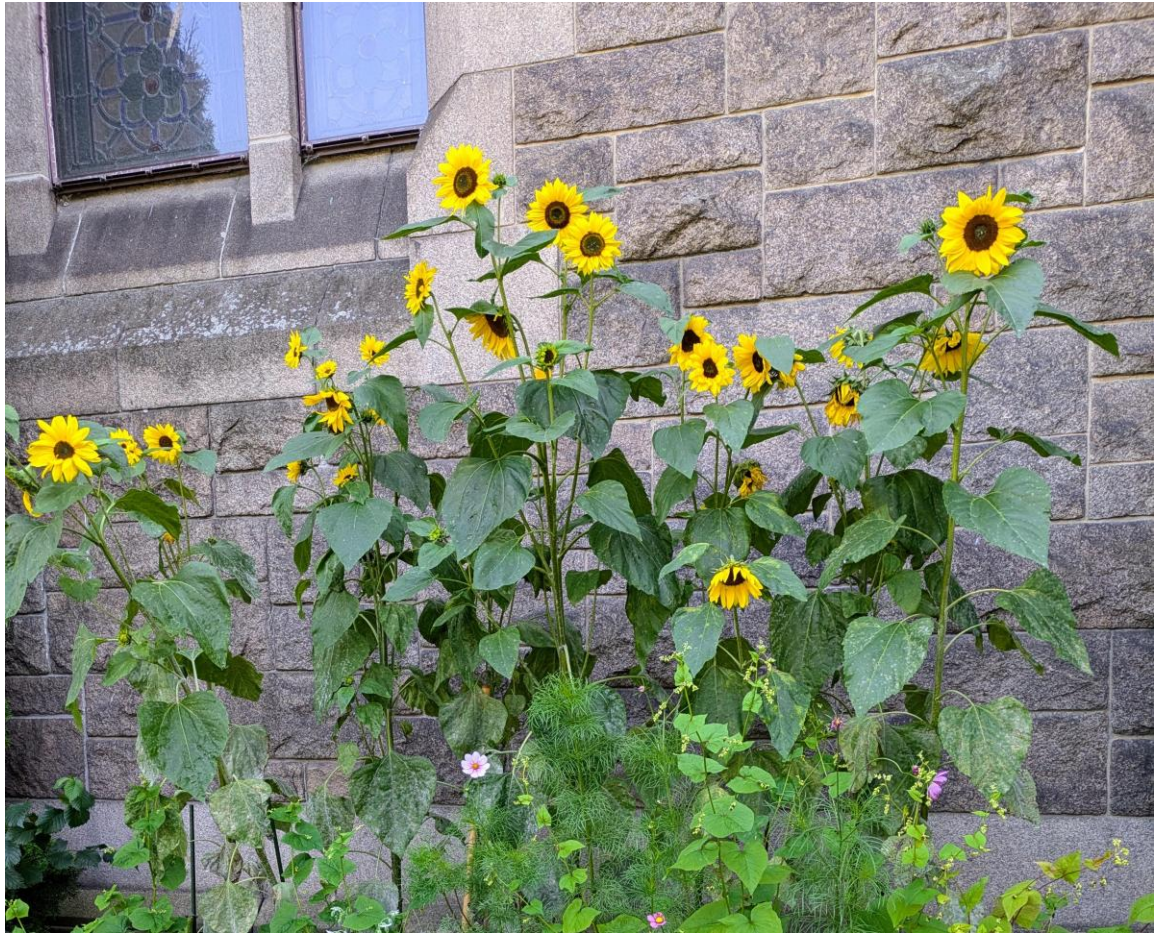
Bilde fra kirkehagen tatt av grønn gruppe