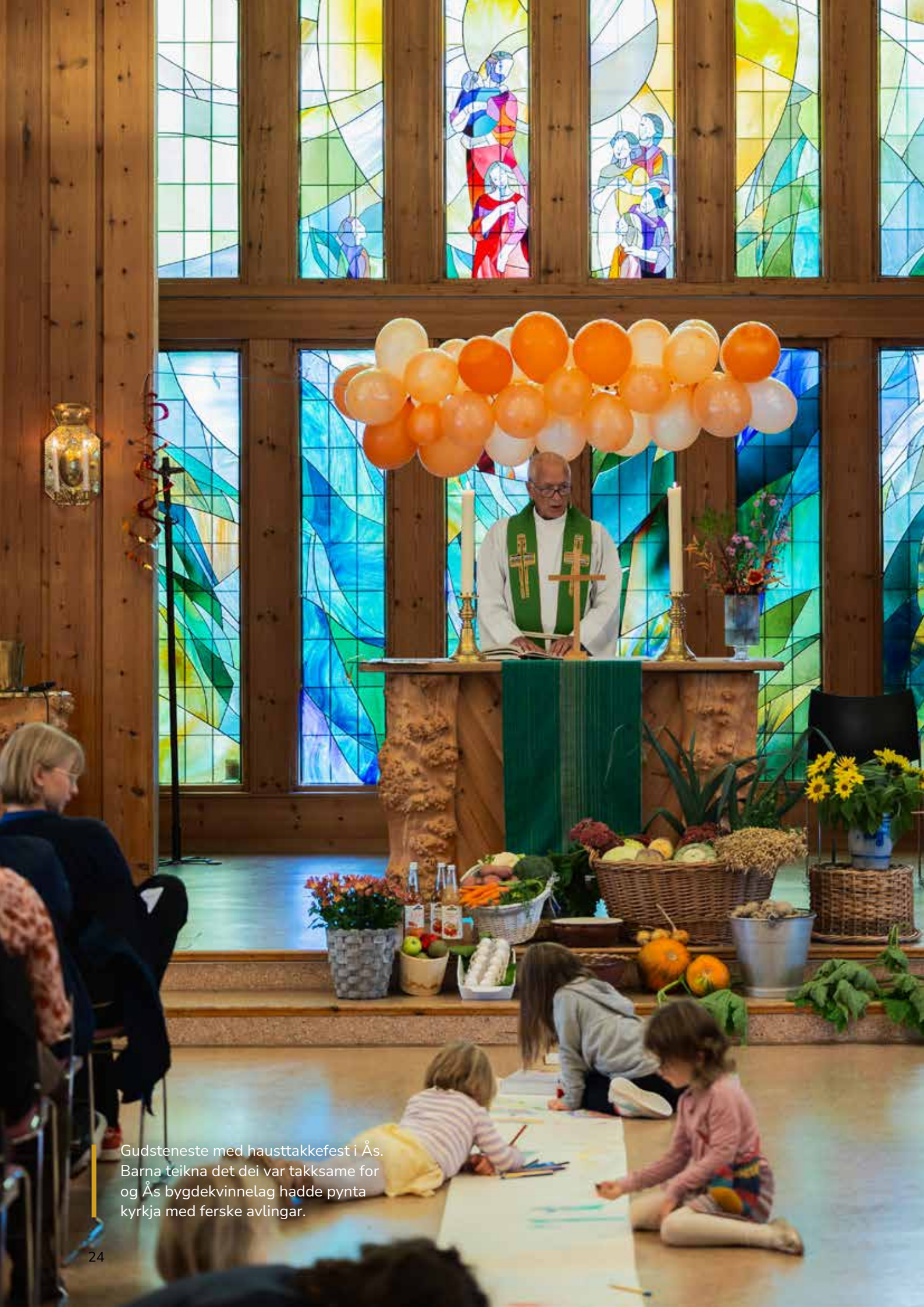
Gudsteneste med hausttakkefest i Ås. Barna teikna det dei var takksame for og Ås bygdekvinne lag hadde pynta kyrkja med ferske avlingar.