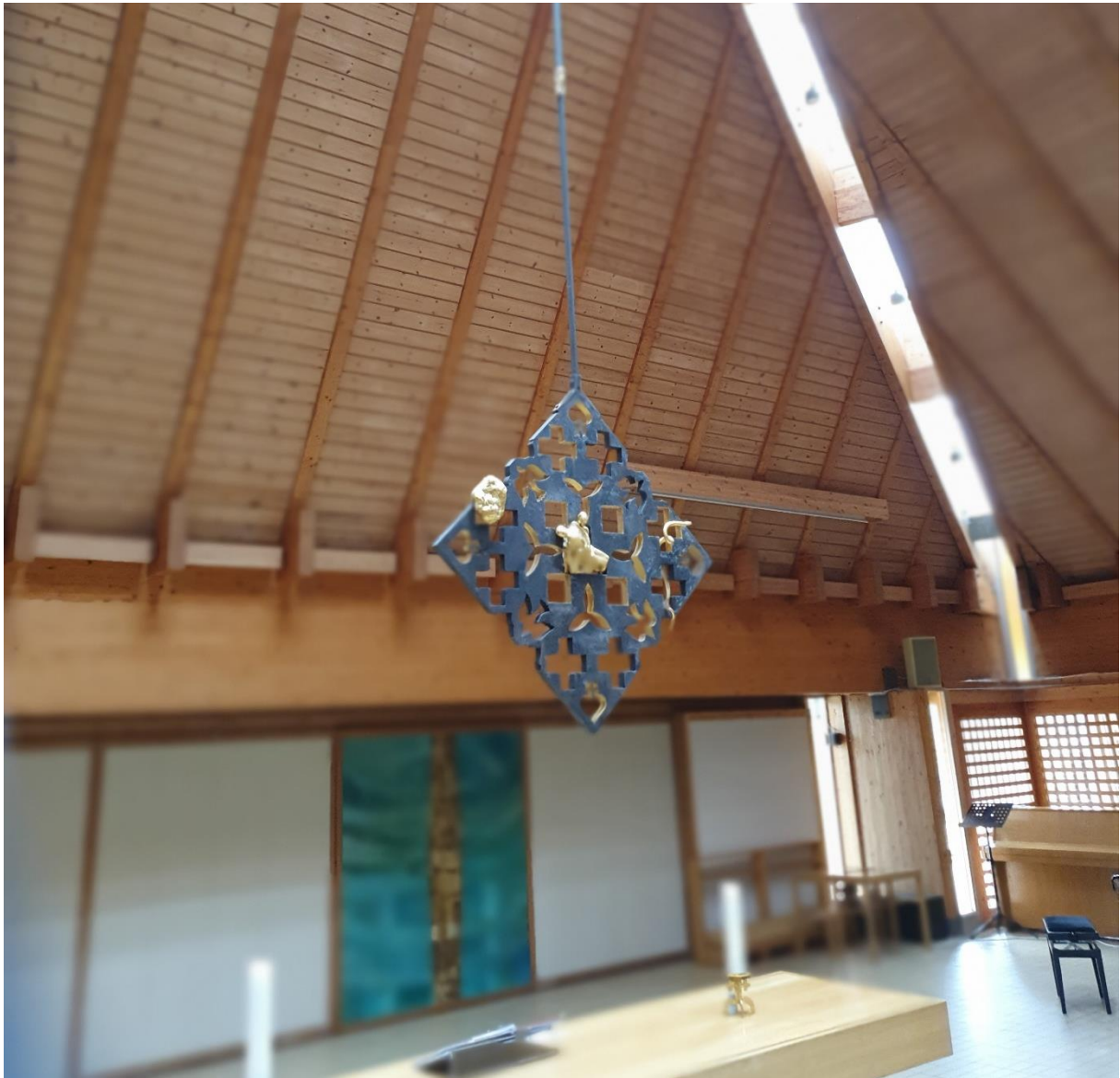
Alterprydet i Søreide kirke