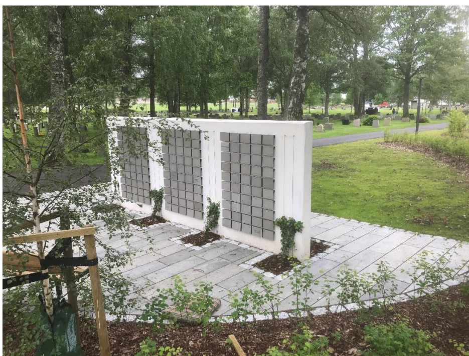
Navnet Minnelund Søndre Slagen gravplass