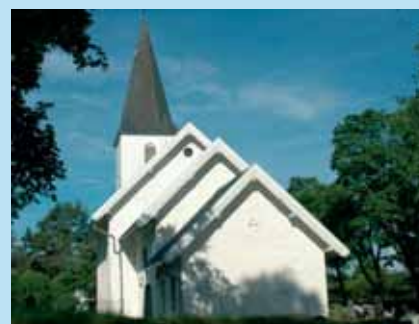
850-årsjubileum for Kråkstad og Ski kirker Side 7