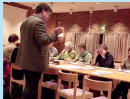
Prestekragen menighets- barnehage nedlagt Side 4-5