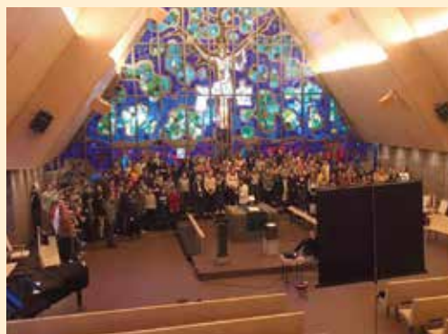
Bilde fra første øvelsen i Jeløy kirke.

Billetter kr. 100,- selges ved inngangen.