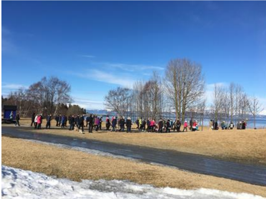
Påskevandring på Midtsand