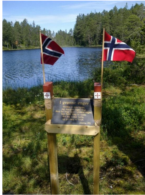
Meditasjonstavle ved Nyvannet