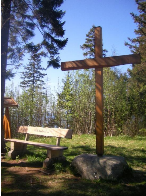
Kors og benk Saksvikkorsen