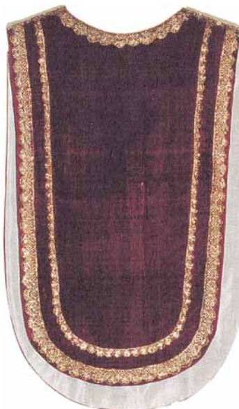
Over: Den eldste messehagelen. Under: Messehagel tatt i bruk 1. juledag 1977, som reflekterer kornåkrene som omgir kirken.