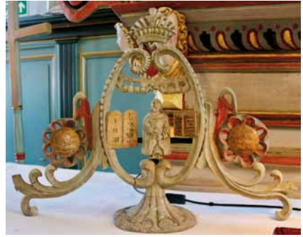
Alteret, lysestaken i tre og tre av de fire stolene (den siste står for tiden i sakristiet)