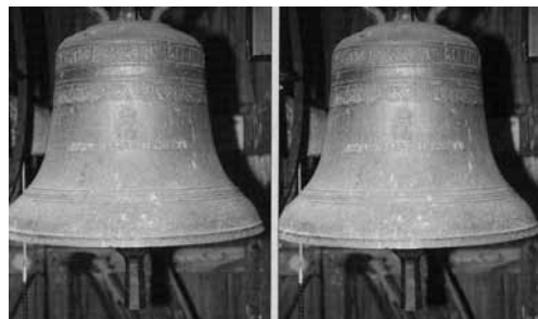
Kirkeklokkene med inskripsjoner