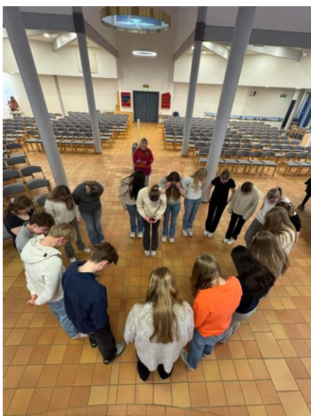
Undervisning i Kirkerom

Vi er så heldige å ha et stabilt godt tall med konfirmanter i Rønvik menighet. I 2024 skal det konfirmeres 85 konfirmanter. Det har vært bo-hjemme-leir, undervisningsgrupper, aktivitetsgrupper som bakegruppe, friluftsgruppe, høstfestival, seminarhelg med Ten-Sing Norway og Re-design. Vi har hatt gudstjenester med to gudstjenesteverksted for halve gruppa til lysmesse før jul, og fastelavngudstjenesten før faste. Det har vært Bynatt i Nordlandshallen sammen med alle de andre konfirmantene fra alle kirkene i Bodø. Konfirmantene deltar med fasteaksjonen i regi av Kirkens Nødhjelp hvert år der de samler inn penger til rent vann til de som ikke har tilgang til det. Det har vært en fin gjeng med konfirmanter dette året.