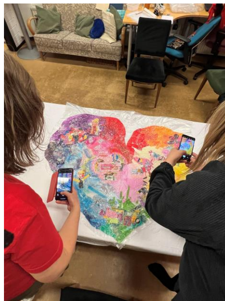
Kreativ konfirmanter på Re innovasjon, kreativt gjenbrukssenter